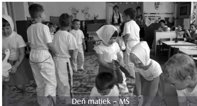
Deň matiek – MŠ