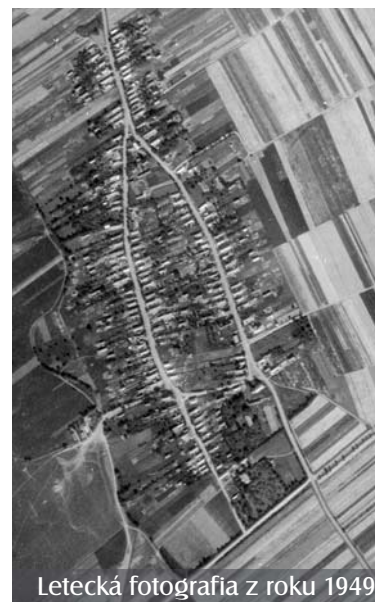
Letecká fotografia z roku 1949

Z archívnych materiálov vybrala Ludmila Geročová