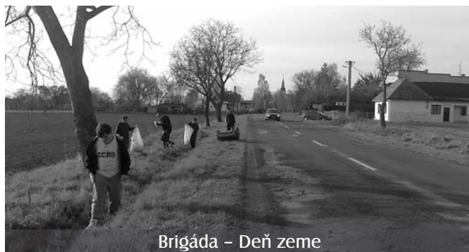
Brigáda – Deň zeme