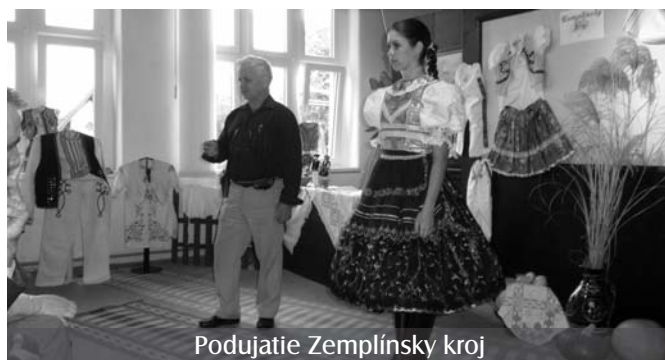
Podujatie Zemplínsky kroj