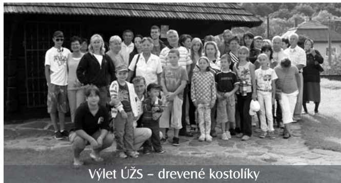
Výlet ÚŽS – drevené kostolíky