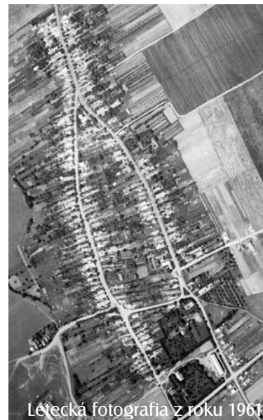
Letecká fotografia z roku 1961